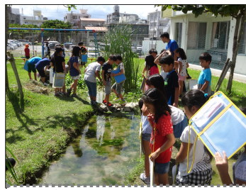
ビオトープ活用授業

本校では、「環境教育の要」としてビオトープを有効活用し、はごろもっ子の豊かな心の育成につなげたいと考えています。また、ビオトープを学校や地域のシンボルとして、半永久的に残していきたい気持ちがあります。ゆくゆくは、土日や休みの日、地域の皆様が自由にくつろぎ、安らげる場となれるよう、「ビオトープ公園」などの名称でコミュニティーの場として解放できたらと考えています。そのためには、地域協働学校の取組の一環として、保護者や地域の皆様方に、保全活動へのご協力をお願いできるよう体制づくりに努めてまいります。