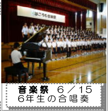
音楽祭 6/15 6年生の合唱奏

3つ目に、「健やかな体」の育成を図る取組を紹介します。私は、平成29年度に赴任しましたが、その当時の健康課題は、むし歯の治癒率が低いことでした。(全児童の35.5%) そのため、「むし歯治癒率目標値60パーセント」を掲げ治癒率向上をめざしました。取組の結果、2年後の今年3月、むし歯治癒率は、驚くべき成果をもたらしました。むし歯の治癒率がなんと、80.6%に達し、むし歯治療率は、2年前に比べ、45ポイント上昇しました。このことから、はごろもっ子の健康課題であったむし歯治療率は、課題解消につながりました。保護者の皆様には、お子様の歯の健康についてのご理解とむし歯の継続的な通院にご協力頂きましたことに感謝申し上げます。