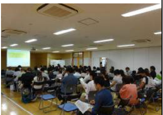
学校経営説明を傾聴する保護者の皆様