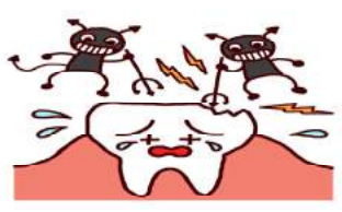
むし歯の治療率をあげることが課題