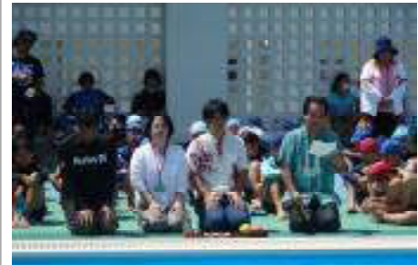
プールサイドでの安全祈願

5月19日（金）、平成29年度のプール開きを実施し、本格的な水泳指導がスタートしました。プール開きでは、6年生が参加しました。水泳学習時の心得として、「プールサイドは、ぜったい走らないこと」「水泳ぼうしはきちんとかぶること」「飛び込みの禁止」などの共通理解を図りました。はごろもっ子には、「クロールで50m以上泳げるようになる」こと等、一人一人が目標を持って、水泳学習に臨んでほしいと期待しています。