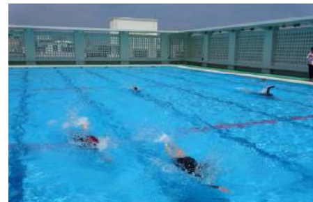
はごろもっ子の泳ぎ初め