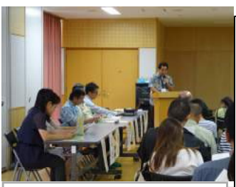
学校経営説明風景

一 親が見本を示して、食後の歯磨きを徹底しましょう。 二 学校から配布された歯科検診結果を確認し、お子さんにむし歯があれば、早めの受診を心がけましょう。