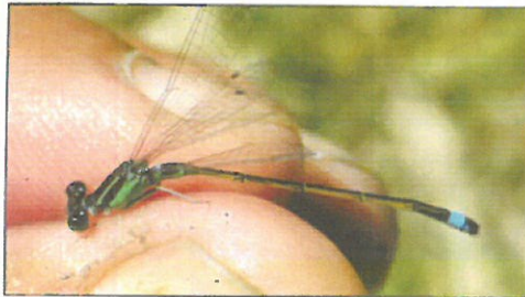
(アオモンイトトンボ)