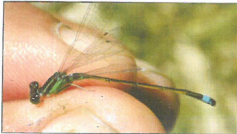
(アオモンイトトンボ)