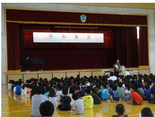
慰霊の日特設授業「平和集会」