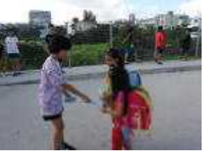
あいさつカード運動

あいさつナンバーワンの地域協働学校をめざして! 我が校が発行している「はごろも」は、朝のあいさつ運動が活発な児童の笑顔が溢れる毎日です。あいさつには個人差がありますが、児童全員が積極的にあいさつができるよう、毎朝、すてきなあいさつができた子に「あいさつカード」を配布し、頑張っています。家庭・学校・地域でのあいさつを大切にするようご指導下さい。