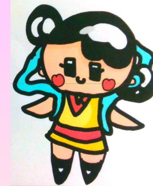
学校キャラクター 「てんちゃん」